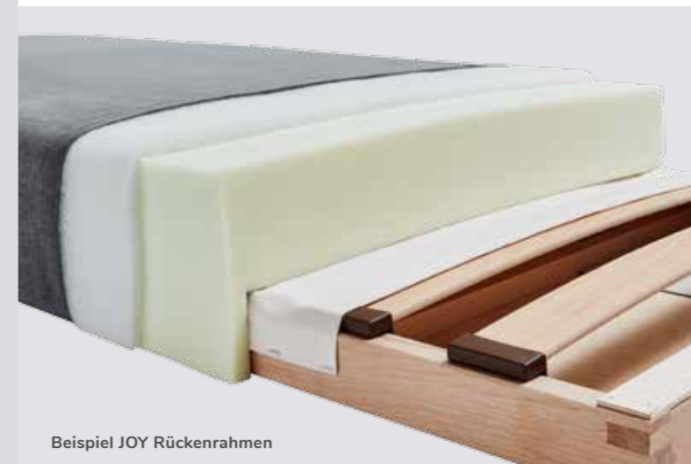
Beispiel JOY Rückenrahmen

Ein vernünftiger und solider Aufbau der Polsterung gehört mit zum Herzstück unserer Schlafsofas. Denn wie man polstert, so liegt man am Ende auch. Bequem, gesund und gemütlich. Neben Katschaumpolsterungen verwenden wir für unsere hochwertigen Auflagen auch Naturpolsterungen. Und beide Arten sind im Aufbau gut durchdacht.