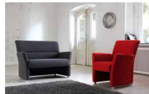
NOLA Zierlicher Einzelsessel und 2-sitziges Sofa