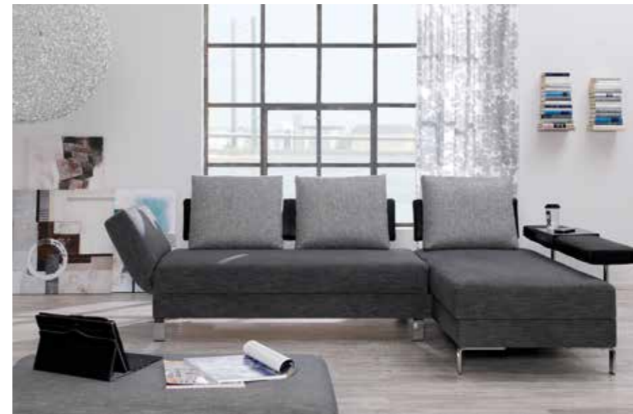
SOLO Liege mit Anstellsofa