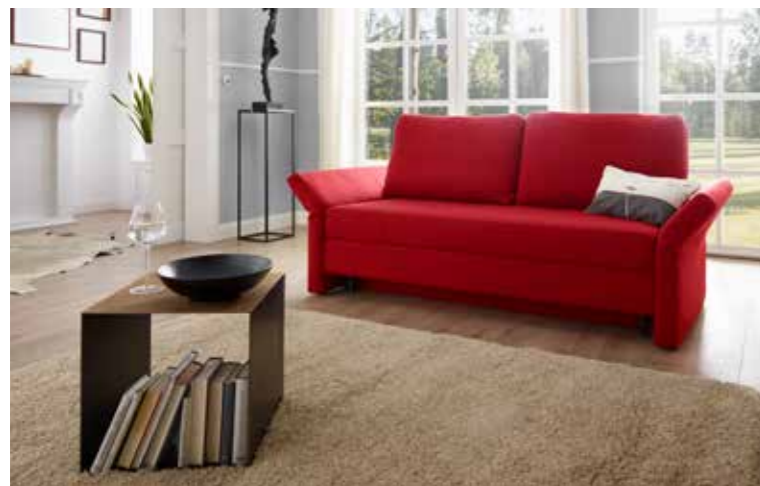
Schlafsofa 160 B 186/224 cm / T 93 cm / H 96 cm Sitzhöhe/-tiefe: 45 cm / 51 cm Liegefläche: ca. 160 x 199 cm