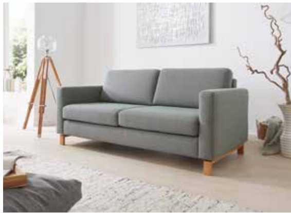
SIRIO Klassisches Einzelsofa und flexible Wohnlandschaft mit vielen Armlehnenformen