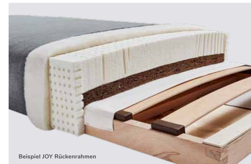
Beispiel JOY Rückenrahmen

Bei der Gewinnung als auch bei allen Stufen der Verarbeitung werden immer ökologische und soziale Aspekte beachtet – aus Überzeugung.