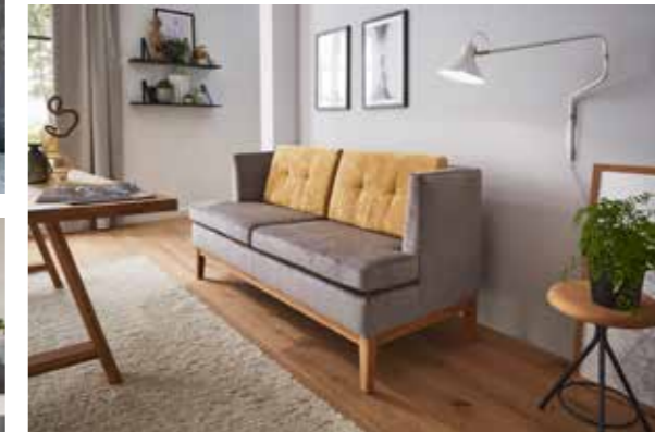
ALTO DINING SOFA Gründerzeitsofa, modern interpretiert