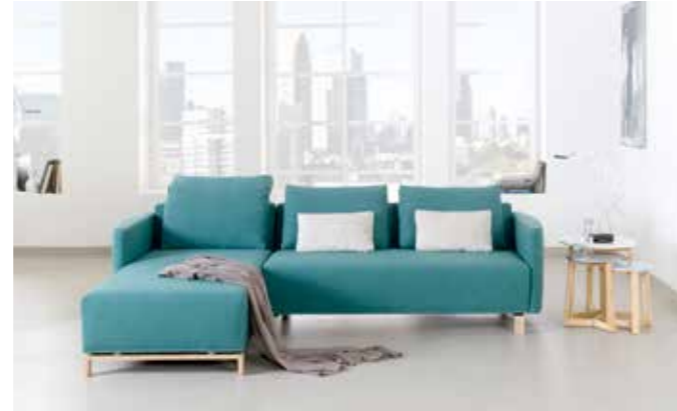
GIO Kompaktes Modulsystem mit abnehmbaren Bezügen