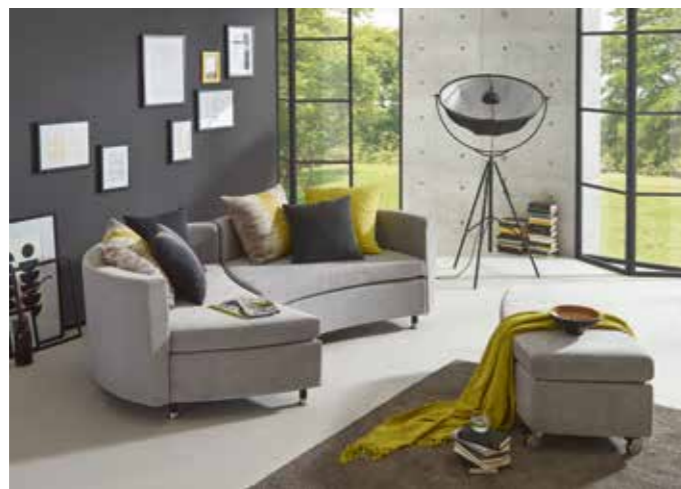
SERENE Die pfiffige Kuschelwiese