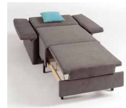
Schlafsessel 80 B 102/140 cm / T 93 cm / H 96 cm Sitzhöhe/-tiefe: 45 cm / 51 cm Liegefläche: ca. 80 x 199 cm