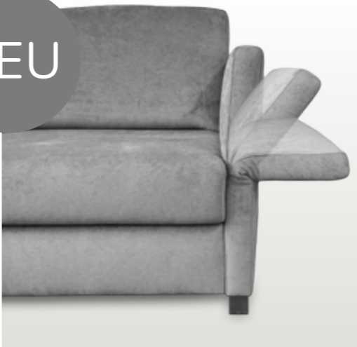
Abklappbare Armlehne 5