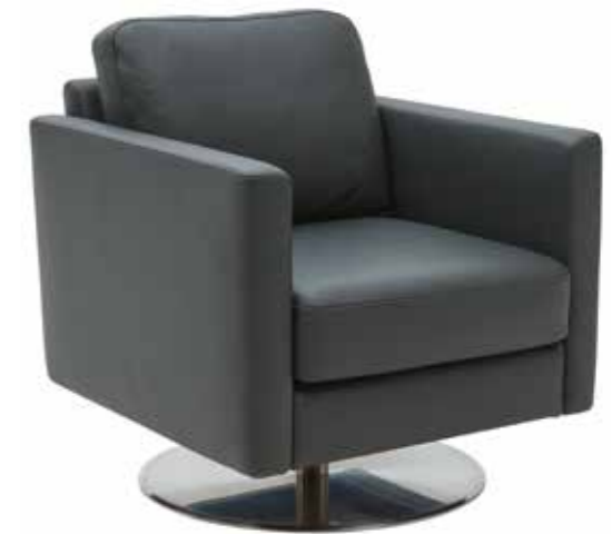
SIRIO Eleganter Drehsessel mit Edelstahlsteller