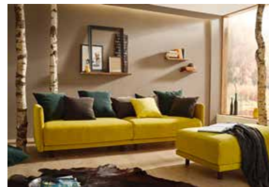
RIVA Kreatives Modulsystem mit abnehmbaren Bezügen